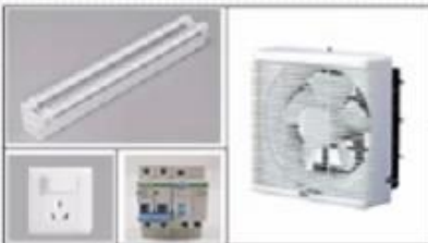
Light, Switch, Air Exhaust Fan