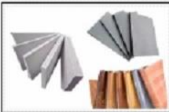
PVC Floor MGO Fireproof Board Fiber Cement Board