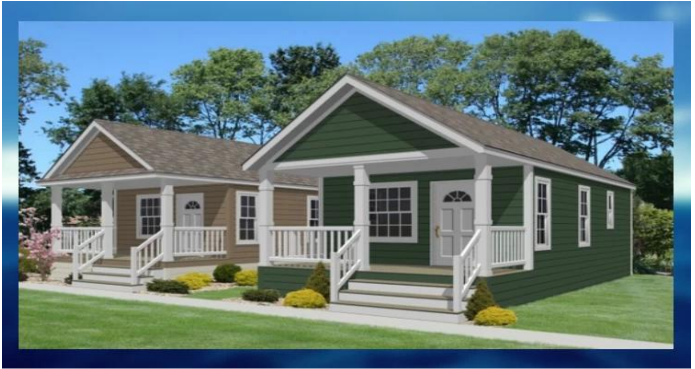
Maison moderne de qualité supérieure préfabriquée HEYA fabriquée en Chine